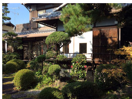
絃の間 Son de Sone

当法人が入居する建物は昭和初期の古民家であり、住宅地がかつて「西の芦屋、東の曾根」と並び称された当時から残る貴重な歴史的建造物です。平成30年の大阪北部地震を機に耐震工事を施し、同時に音楽サロンとして再生しました。同サロンでは本格的な室内楽コンサートが催されており、当法人はその企画や曲目解説等において主に学術的な支援をしています。