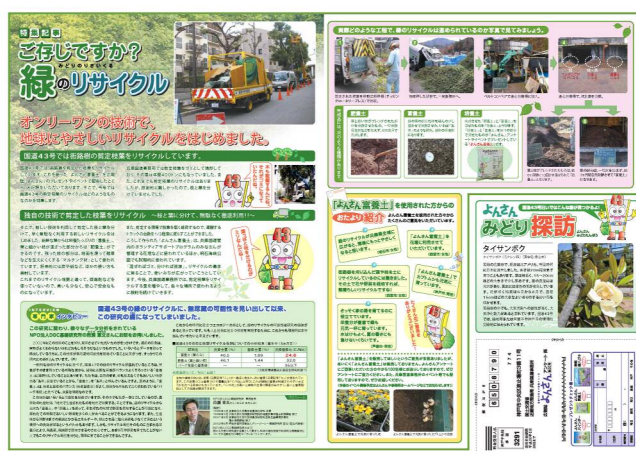
国道43号エコ情報ニュース「よんさん」(2007年6月号)

にて全国規模での適用が検討されていましたが、国の政権交代とともに立ち消えとなりました。さらに、大阪府吹田市においても導入が内定していましたが、市長の交代により延期された状態が続いています。また、ある大手住宅関連会社との業務提携による事業化も検討されました。いずれも技術的な価値とは関係のない理由で実現していませんが、当法人は技術を紹介する Web サイトを管理するなどの広報活動を続けています。